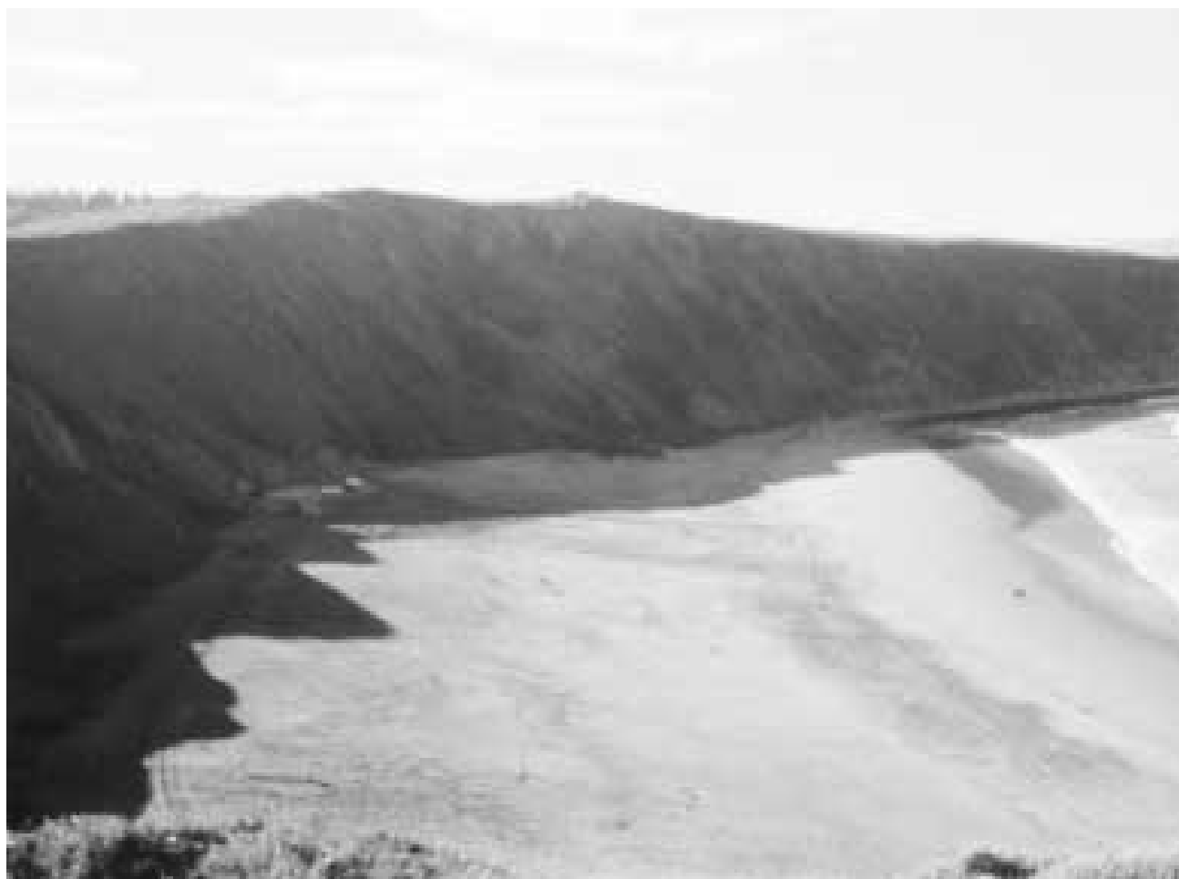
Playa Salvaje en Sopela (Bizkaia)

Boletín informativo de E.N.E. Número 1 Marzo de 1.998.