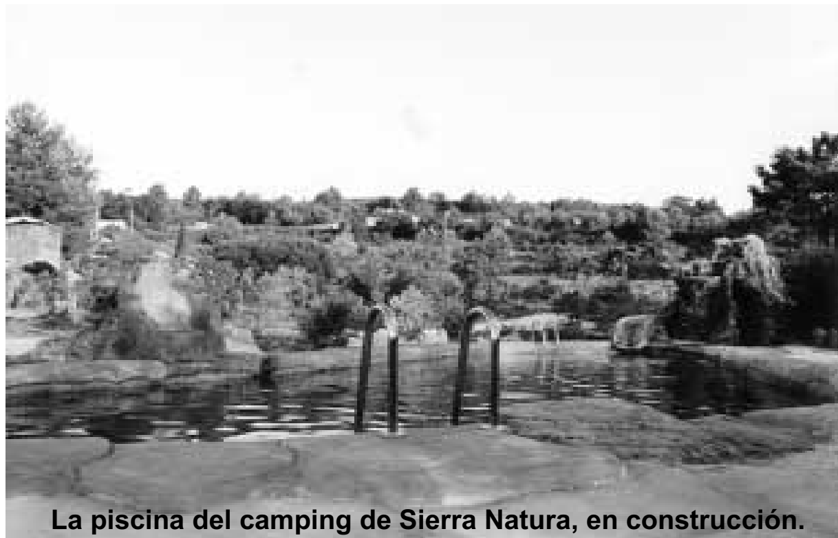
La piscina del camping de Sierra Natura, en construcción.

En la Sierra de Enguera, dentro de la provincia de Valencia se está terminando la construcción del camping Naturista SIERRA NATURA.