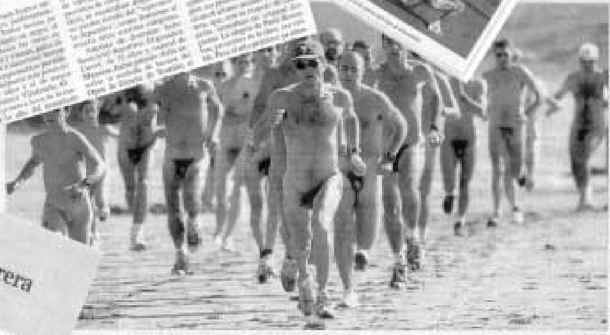
El día de la carrera...